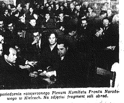
Z posiedzenia rozszerzonego Plenum Komitetu Frontu Narodowego w Kielecach. Na zdjęciu: fragment sali obrad.