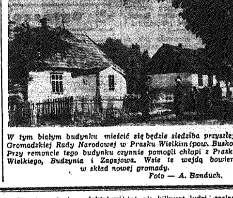
W tym białym budynku mieścić się będzie siedziba przyszłej Gromadzkiej Rady Narodowej w Prasku Wielkim (pow. Busko). Przy remoncie tego budynku czynnie pomogli chłopcy z Piaska Wielkiego, Budzyna i Zagajowa. Wsie te wędzą bowiem w skład nowej gromady.

czego, w obronie wolności słowa, zebrani, strzeszeni, manifestacji itd. Dla klasy robotniczej nie jest wszystko jedno, czy istnieje parlamentaryzm, czy też faszyzm. Nie jest również obojętne, czy burżuazja uda się usunąć parlamentarne przeszkody na drodze do faszyzmu. Wykorzystanie legalnych możliwości siły walki, wykorzystanie parlamentaryzmu jest niezbędne dla przejścia do wyższej formy demokracji, do prawdziwego i pełnego ludowładztwa. Obrona, względnie walka o wolność demokratyczne w systemie parlamentarnym wiąże się nierozdzielnie z demaskowaniem drobnoburżuazyjnej, prawicowo — socjalistycznej polityki występującej w klasie posiadającej. Jakże charakterystyczna pod tym względem jest rola robotnicza francuskiej partii socjaldemokratycznej, które siły polityki użądliły strajk górników. Obecnie jest to prawicowo — socjalistyczna polityka amerykańskiego planu militarnego i polityki zachodnich, wkręcających Hitlerowskiego Wehrmachtu.