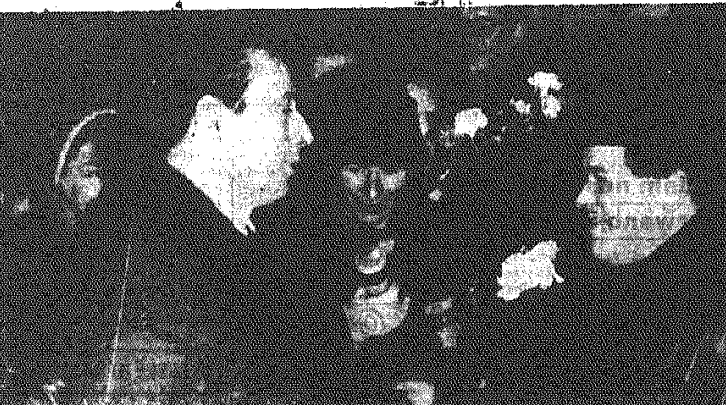
Dnia 10.I.1957 r. przybył do Warszawy znany piosenkarz francuski Yves Montand. Na zdjęciu: powitanie na lotnisku Okęcie w Warszawie.

— Mówi AR, proszę o połączenie: Yves Montand, Moskwa. Moskiewska telefonistka nie szukała nawet hotelu. Odrzekła: „Strasnie mi żal, ale już wyjechał do Kijowa”. Warszawska telefonistka zaproponowała mi od razu: „Niech pani poczeka, zaraz dojeżdża”. Telefonistka kijowska też wywierała samo nazwisko, bez adresu i bez numeru telefonu, połączyła natychmiast z hotelem. Ale tu już, nieśmiały, w znowu kobiet wleciał się mężczyzna, towarzyszył Montandowi w jego radzieckim tournée. Trzeźwo i krótko stwierdził: po pierwsze Montand jeszcze śpi, po drugie i tak bym nie pozwolił mu rozmawiać, bo przez telefon nadwiera się głos, a po trzecie za kilkanaście godzin Montand wyjeżdża do Warszawy i wywiad będzie można zrobić na miejscu. Nie ma co mówić, radykalnie odstąpił nadzieję trzech kobiet, które tak niecierpliwie czekały na głos Montanda.