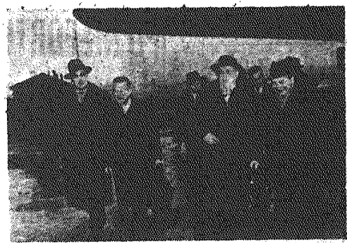
W dniu 28.1. br. przybyła do Warszawy 4-osobowa delegacja Francuskiej Partii Komunistycznej. Na zdjęciu: Powitanie delegacji na lotnisku Okęcie.

W niedzielę pomocy repatriantom wyróżnia się społeczeństwo Warszawy, a zwłaszcza stożne zakłady pracy. Niektóre z nich dostarczają na drogę samochodów dla przewożenia repatriantów i ich dobytków, inne — organizują zbiórki pieniędzy i odzież.