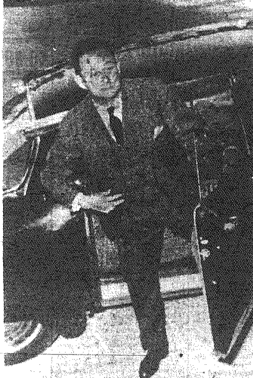
Bourges — Maunoury.

PARYŻ PAP. Jak donosi agencja France Presse, Bourges — Maunoury ustalił listę nowego gabinetu, którą przedstawi Zgromadzeniu Narodowemu. Obsada głównych tek w projektowanym gabinecie jest następująca: premier — Bourges — Maunoury (partia radykalno — socjalistyczna), spraw. zagraniczne — Pineau (SFIO), ministerstwo spraw wewnętrznych — G. Jules (partia