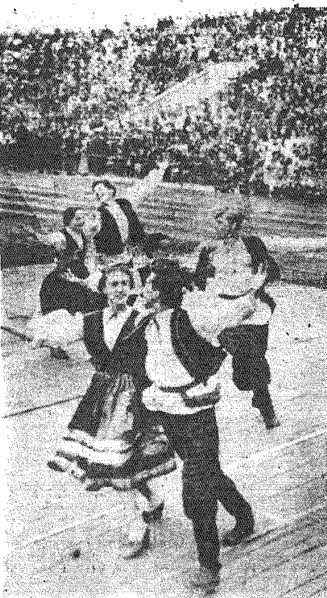
Na zdjęciu: Kiszyniew. Występ szkolnego zespołu tanecznego w czasie eliminacji przedfestiwalowych.