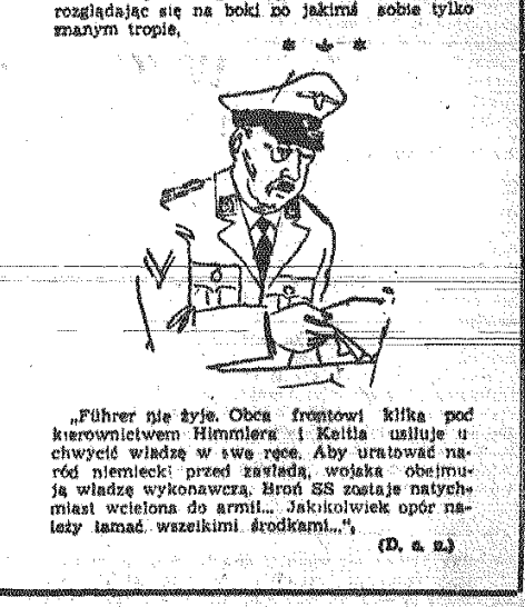
(D. a. z.)