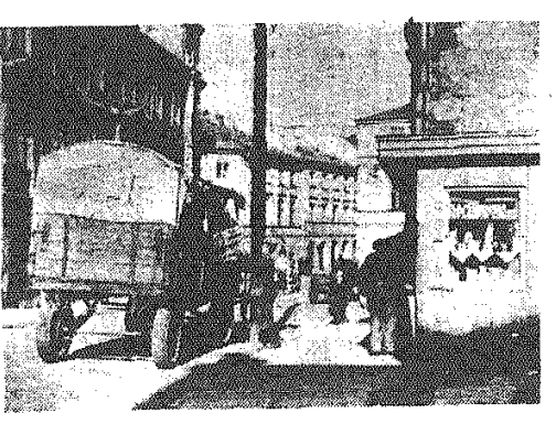
Oto wóz z towarami już nie za trzymał i za chwilę kupimy w kiosku jabłka, które właśnie zabrakło.