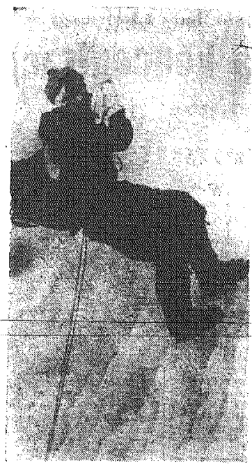
Rząd nepalski udzielił ekspedycji saskawarskiej zezwolenia na wyprawę na szczyt Dhaulagiri w Himalajach, najwyższym z niedostępnych dotąd szczytów świata. Członkowie wyprawy, która...

USA dążą do odroczenia debaty w ONZ Opinia Libanu popiera Syrię Spotkanie Gromyki z szefami delegacji Syrii, Egiptu, Indii i Indonezji