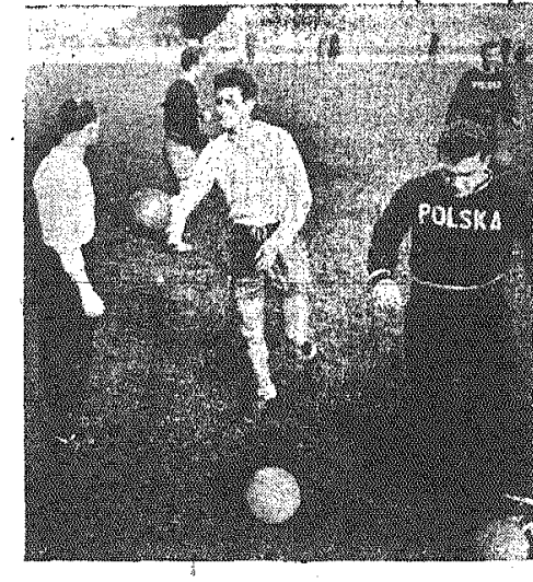
Na zdjęciu: (od lewej) trener Celbuda, Korynt, i Szczepański podczas treningu.