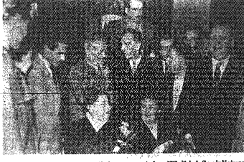
20.X. hawajcy w Polsce uczestnicy Wielkiej Socjalistycznej Rewolucji Październikowej spotkali się z załogą Warszawskich Zakładów Budowy Urządzeń Przemysłowych im. Waryńskiego. Na zdjęciu: górnicy radziecy serdecznie powitani przez aktyw zakładów.