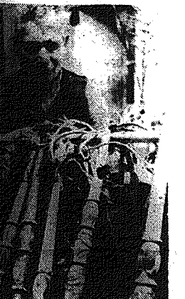
Takich wianów batów używali niegdyś pasterskie z węglarkami puszy, znakomicie jędrzy. Obecnie wyroben piękne plicionych batów z rzeźbionymi drewnianymi trzonkami trudnią się ludowi artyści - rzemieślnicy, dostarczając je jako pamiątki dla turystów.