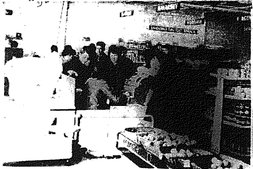
W nowoczesnym pawilonie handlowym na Ustroniu nie tylko ładnie eksponuje się towar ale i zaopatrzenie jest bardzo dobre.

Nasz adres: Radom, ul. Żeromskiego 36, tel. 237-36