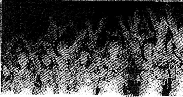
Na zdjęciu: strojem ubrane dziewczęta wrocławskie pozdrawiają gospodarzy festi- walu.

Szpital na 331 łóżek którego budowę zakończy się w 1978 roku — będzie ko- szował blisko 200 mln zło- tych, a pomieszczenia w nim znajdą oddziały: chirurgicz- ny, wewnętrzny, laryngolo- giczny, położniczo-ginekolo- giczny i dziecięcy. W budo- wku zlokalizowane też będą wszystkie przychodnie spec- jalistyczne oraz pogotowie ratunkowe, a obok szpitala hotel dla pielęgniarek i pra- cowników służby zdrowia.