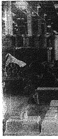
Kwasoodporne zlewy... i inne szlachetne wyroby produkuje suchedniowski „Marywil”. Na zdjęciu: przegotowywanie zlewów do wypalania.