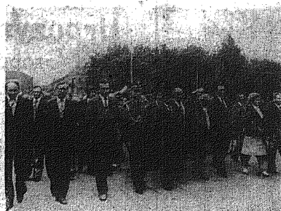
Przedstawiciele władz i społeczeństwa ziemi radomskiej złożyli wieńce przed pomnikiem Wdźleczności (szersza informacja na str. 3).