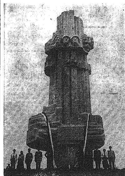
U stóp odsłoniętego w Kielcach pomnika Bojowników o Wyzwolenie Narodowe i Społeczne zaciągnięto warty honorowe (szersza informacja na str. 3).