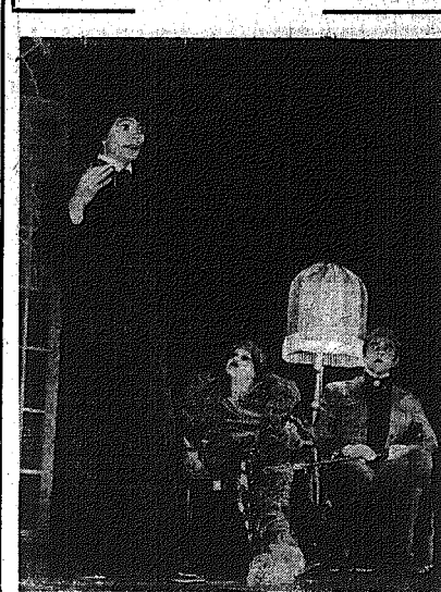
Scena z „Sonaty Bełzebuba”.

Teatr Powstaniec im. Jana Kochanowskiego w Radomiu stworzył seten premier na 1000 widzów. Wskazując na to, że oświata jest pojęciem wieloznacznym, należy przede wszystkim zwrócić uwagę na jej funkcję społeczną. Oświata jest nie tylko formą przekazu wiedzy, ale przede wszystkim formą kształcenia człowieka.