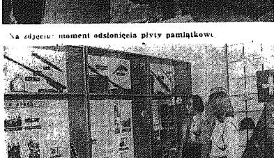
Na zdjęciu: moment odsłonięcia płyty pamiątkowej

3 nowe przedszkola na Uro- czystości Podkarpackiej przy ul. Komandora. Placówki te powstały dzięki pomocy kiel- czyńskich zakładów pracy, m.in. Kielczyńskich Zakładów Wyrobów Papierowych, Wojewódzkiego Zrzeszenia Prywatnego Handlu i Usług RSM „Armatura” i „Iskry”. Do końca tego roku szkolnego zostaną oddane do użytku kolejnymi trzy przedszkola w osiedlach Świętokrzyskiej Uroczystości.